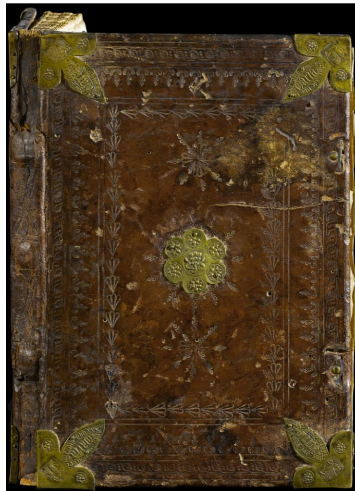
Milano, Archivio Storico Civico e Biblioteca Trivulziana, Cod. Triv. 720 (piatto anteriore)

Stato di conservazione: discreto. Alcune spellature del cuoio, stanco lungo il dorso.